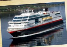
MS Midnatsol Bygget 2003 970 passasjerer